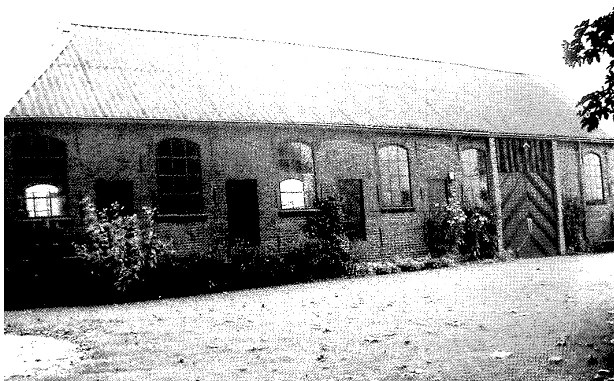
De werkplaats van voorheen scheepswerf Kuiper.