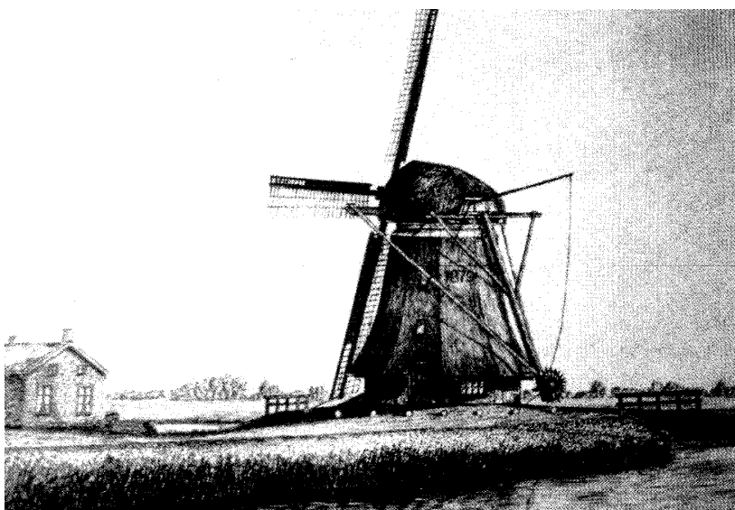
De molen bij Rohel

Op de eerste kadastrale kaart van 1832 is al het land ten noorden van Rohel aangegeven als vergraven land. In de landerijen werd turf gebaggerd. Met een baggerbeugel werd de baggerspecie omhoog gehaald, waarna het op zetwallen te drogen werd gelegd. Vervolgens werden er turven van gesneden. In 1879 is de Rohelsterpolder aangelegd. Er werd een perceel grond aangekocht met het doel om daarop een molen en een molenaarswoning te laten bouwen. Met behulp van een windmolen werd het water uit het laaggelegen, moerassige gebied gepompt. Toen deze molen in 1914 na een blikseminslag afbrandde, kwam er een stoomgemaal. Er werd een ketelhuis gebouwd en een pijp opgemetseld. Hendrik Tjoelker werd de machinist. In 1926 werd hij opgevolgd door Hendrik de Haan. Vanwege de hoge brandstofkosten, zo rond 1936 in de crisisjaren, klaagde het bestuur steen en been, want het gemaal vrat steenkool. Daarom kwam er een dieselmotor voor in de plaats, die in 1946 door een elektrisch gemaal vervangen werd. Door de ontwatering werd het land bruikbaar voor de landbouw. Tegenwoordig probeert men weer terug te keren naar de oude situatie; het land is weer onder water gezet.